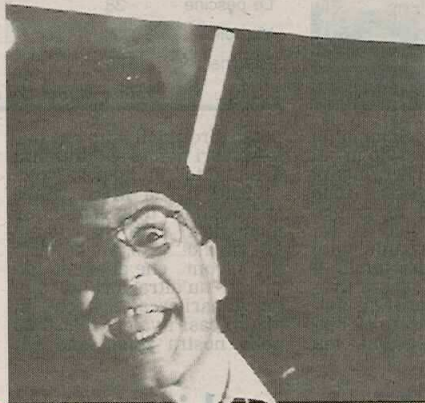
A destra Paolo Hendel, il comico sarà a Volterra il 27 novembre; a sinistra una scena dello spettacolo Pescecani

cale «Ceramicheliniari» e gli attori cantanti della Compagnia della Fortezza, il gran finale invece è nelle mani di Alessandro Benvenuti (21 dicembre) con «L'atletico ghiacciaia». Parallelamente agli spettacoli verranno attivati laboratori sulla creatività per